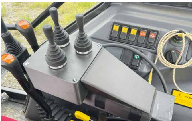
Joystickbedienung für Traktoren