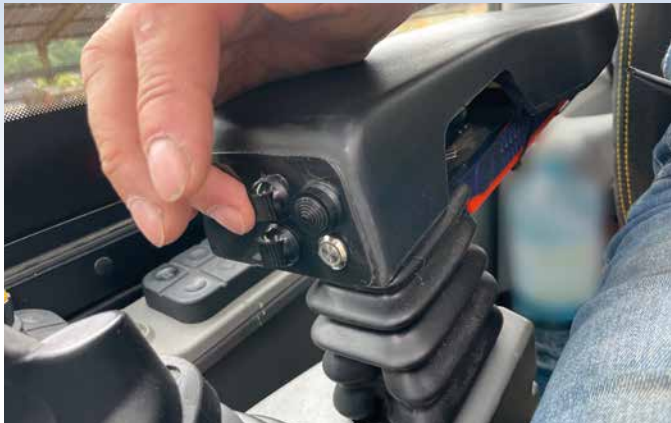
Bei Mobilbagger in die Armlehne integrierte Tastatur für die Graderbedienung.